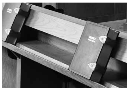
In de moderne theologie is het subject, de gelovende mens, beslissend geworden ten opzichte van Gods Woord.

In de vierde plaats heeft de moderne theologie een heel andere visie op de reikwijdte van Gods Woord. Men denkt dan anders over het verbond: 'De tegenstelling tussen het werkverbond en het genadeverbond is, vaak onder de invloed van de gedachte aan de evolutionaire wording van de mens, verdwenen'. Als de historische zondeval wordt ontkend, rest eigenlijk alleen het genadeverbond.