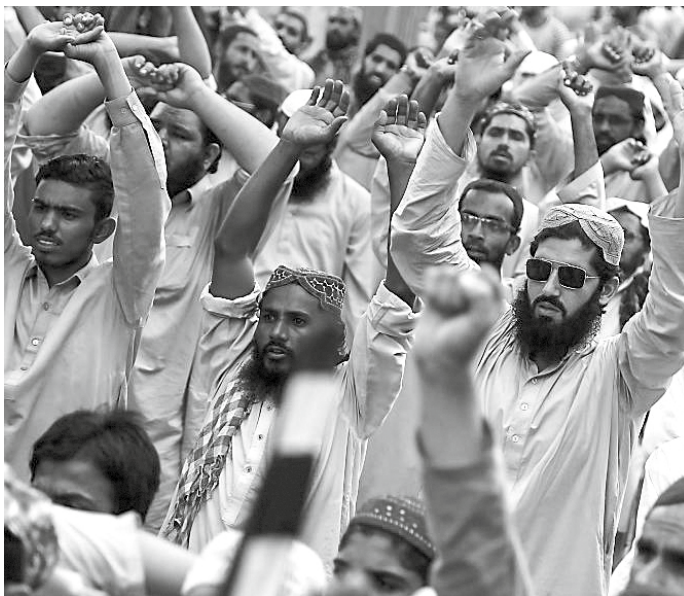
In Pakistan werden tegen de cartoonwedstrijden van Wilders grote protestdemonstraties gehouden.

In kranten en tijdschriften wordt geprobeerd om de lezer te raken. Soms door een vlijmscherp commentaar, door een scherp opiniestuk of met een column. Bedoeld om een tegengeluid te geven of juist om een extra signaal af te geven. Op zich kan dat nuttig zijn binnen de grenzen van het betamelijke.