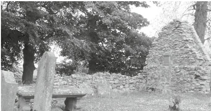
Boston was 23 jaar, toen hij bevestigd werd in zijn eerste gemeente, Simprin. Foto: de overgebleven ruïne van de kerk te Simprin.

Nog maar 23 jaar was Thomas Boston toen hij op 21 september 1699 in zijn eerste gemeente, Simprin, bevestigd werd tot predikant. Maar voordat het zover was, verkeerde hij vele dagen, zoals hij zelf zei, 'in een rusteloze toestand'. Hoe zou hij, een kleine jongeling, ooit in staat zijn een bruid voor Christus te werven, om een visser van mensen te zijn?