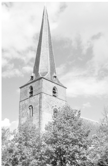
De kerkorde blijft ons de Bijbelse weg wijzen voor de inrichting van het kerkelijk leven.

Is deze kerkorde nog wel bruikbaar in onze tijd? De formuleringen van de DKO zijn sterk gedateerd. Wie weet nog wat 'credentiebrieven' zijn? Wat betekent het als dienaren van het Woord 'refuseren' om de belijdenis te ondertekenen?