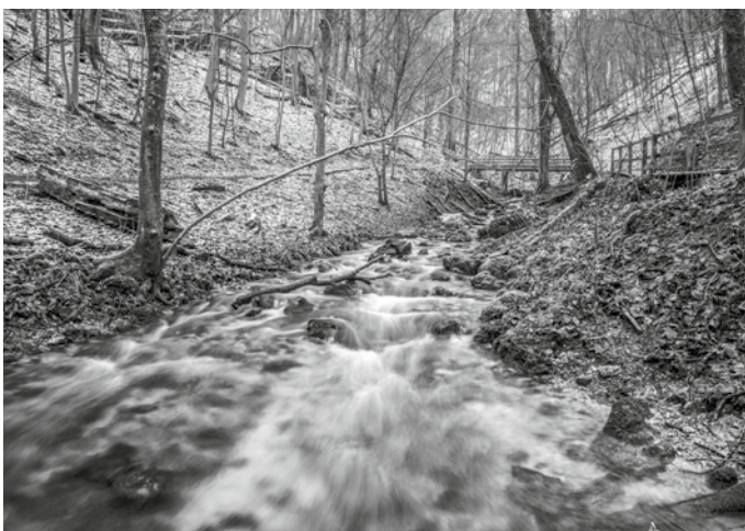
Het gaat over een volle Bron die nooit leeg raakt.

Wanneer het adventsvolk wordt gebracht bij deze Bron, wordt niet alleen het wonder van Gods genade gesmaakt, maar ook de waarheid van Gods beloftewoord beleefd. Waardoor een arme zondaar door het geloof mag zeggen: ‘en dat ook voor mij’. Hebt u al mogen putten uit deze Bron? Wat een wonder, deze Bron raakt nooit leeg! Iedere keer weer blijkt er een overvloed van genade te zijn voor de grootste der zondaren. Er is bij deze Bron zo’n overvloed dat ook u/jij nog zalig kan worden.