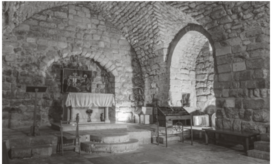
'En Hij leerde in hun synagogen...' (synagoge Nazareth, Israel)

Ook blijkt het soevereine van Gods genade in Christus een oorzaak van