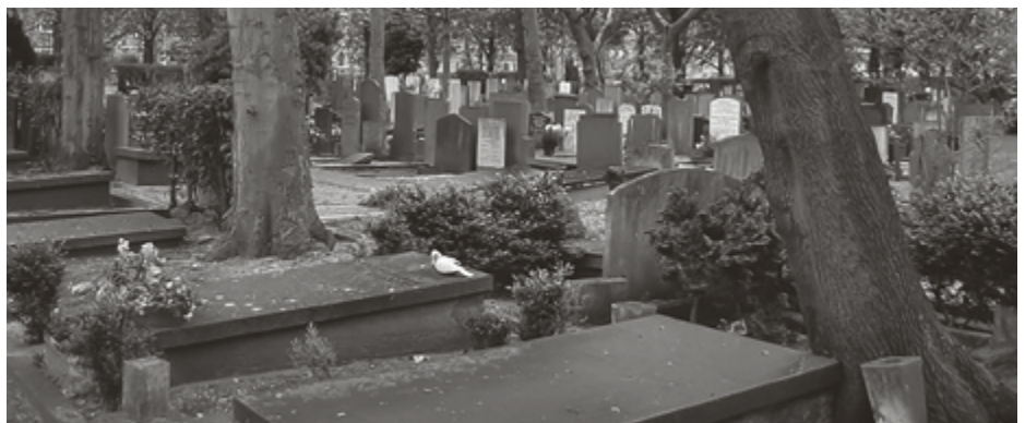
Op Oud Eik en Duinen zegt alles: Memento mori .

Na afloop kwam iemand naar mij toe. Hij had de leiding op deze bijzondere begraafplaats. 'Meneer, wat u nu gedaan hebt, moet u nooit meer doen!' U kunt zich mijn schrik wel voorstellen. Wát nooit meer doen? 'U hebt Psalm 103:8 laten zingen, dat mag nooit gebeuren zonder vers 9'. Beleefd heb ik hem bedankt en vol van gedachten keerde ik terug naar mijn woonplaats Zoetermeer. Toen ik er thuis over nadacht moest ik zeggen: hij had gelijk... Hij heeft gelijk! Vers 8 is maar de helft. Vers 8 eindigt in de dood. Vers 9 geeft de tegenstelling aan: een Goddelijk 'maar'. Een 'maar' uit het welbehagen van de HEERE. Een Evangeliewoord. Eeuwige gunst voor allen die de Heere door genade kinderlijk leren vrezen, voor allen die hun hoop op Christus leerden stellen, zelfs in het late nageslacht. Niet alle dingen die vanuit Den Haag worden voorgeschreven, waardeer ik. Maar wat mij betreft spreken we altijd met twee woorden. En zingen we altijd deze twee verzen uit Psalm 103, allebei.