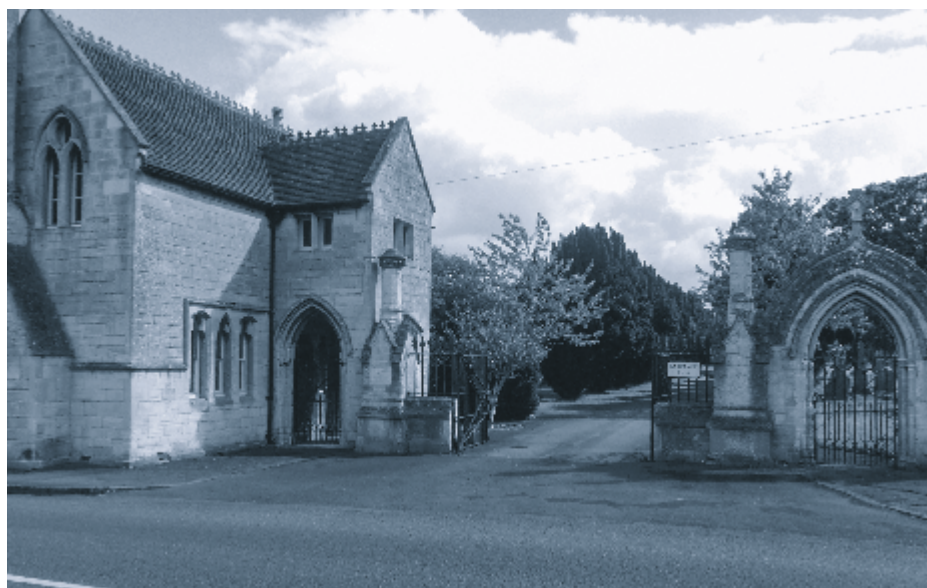
John Warburton ligt begraven op de begraafplaats aan Road The Down te Trowbridge.