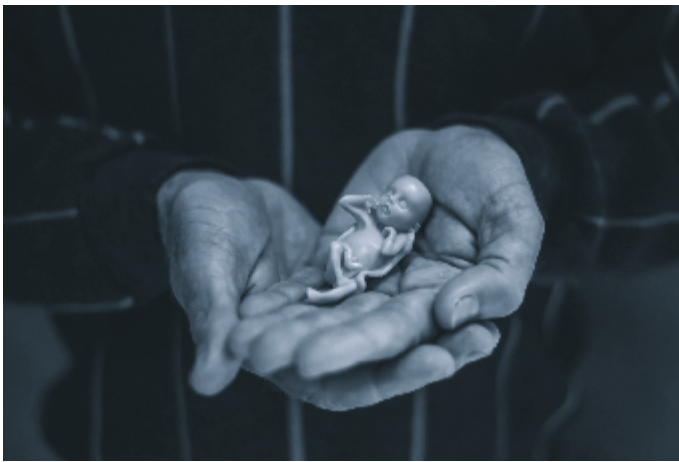
Een mensenkind, geschapen door God, wordt door mensenhanden verwoest, aan de lopende band.

Laten we bidden om wederkeer, vergeving en verzoening. Laten we bidden voor de zielen van die ongeboren kinderen, die het leven wordt ontzegd. Laten we er nooit aan wennen, ook als de bedenktijd wordt teruggebracht naar een fractie van een seconde. Overigens, voor de Heere is die tijd niet te kort!