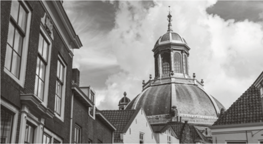
In Middelburg duurde het niet lang of De Kok was weer ouderling.