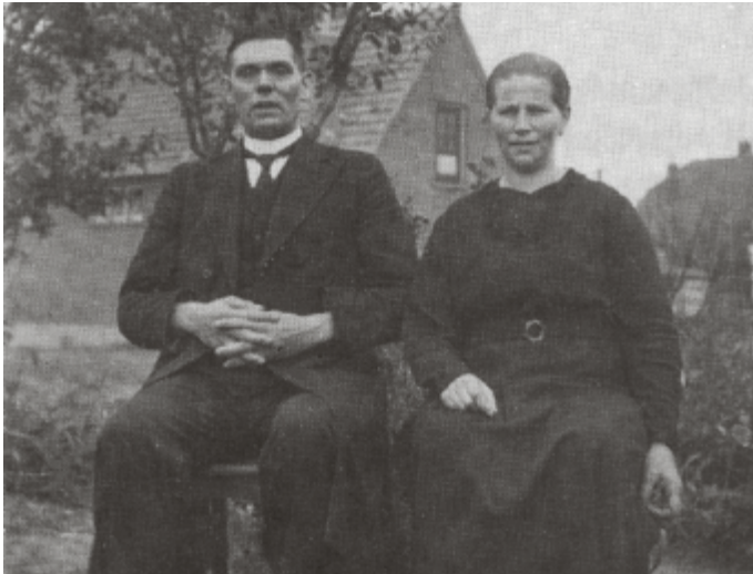
Het echtpaar Ligtenberg

Over domineesvrouwen is veel geschreven. In dit artikel beperken we ons veiligheidshalve maar tot enkele dingen van lang geleden. Deze rubriek heet trouwens ook 'Uit vroeger jaren'.