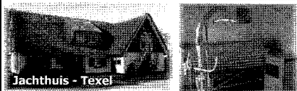
Jachthuis - Texel

2 luxe drempelvrije vakantiewoningen onder 1 kap, 7 en 8 persoons. Per woning: 2 hoog/laag bedden, douche-brancard en tillift. Tevens voorzien van vaatwasser, magnetron, wasmachine en wasdroger. Incl. schoonmaakkosten, € 275,- tot € 695,- p.w.