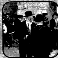
Joden in gesprek