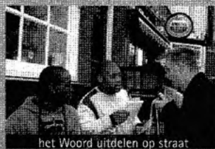
het Woord uitdelen op straat