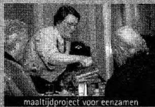
maaltijdproject voor eenzamen