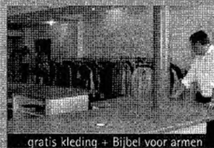
gratis kleding + Bijbel voor armen

Wellicht bent u ook voornemens om deze maand iets extra's te geven aan een goed doel. Mogen wij u onder de aandacht brengen dat u met één gift meerdere goede doelen kunt steunen? Het Deputaatschap voor de Evangelisatie werkt onder eenzaam met het verstrekken van maaltijden, onder (allochtone) kinderen met kinderclubwerk, verspreidt Gods Woord op straat onder de mensen, verstrekt kleding met een Bijbel aan armen.