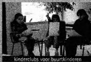
kinderclubs voor buurtkinderen