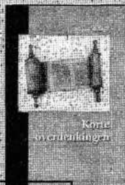
Korte overdenkingen A. van de Kleef