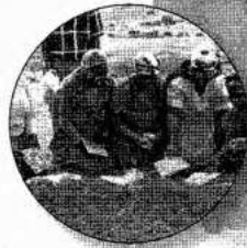
Zuid-Afrika Strijd tegen HIV / Aids