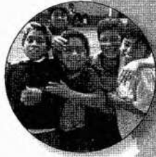
Peru Aandacht en liefde voor straatkinderen