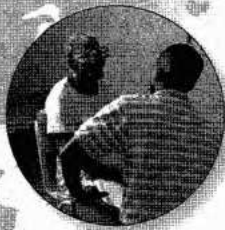
Dominicaanse Republiek Gezondheidszorg