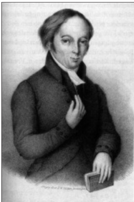
Ds. Hendrik de Cock