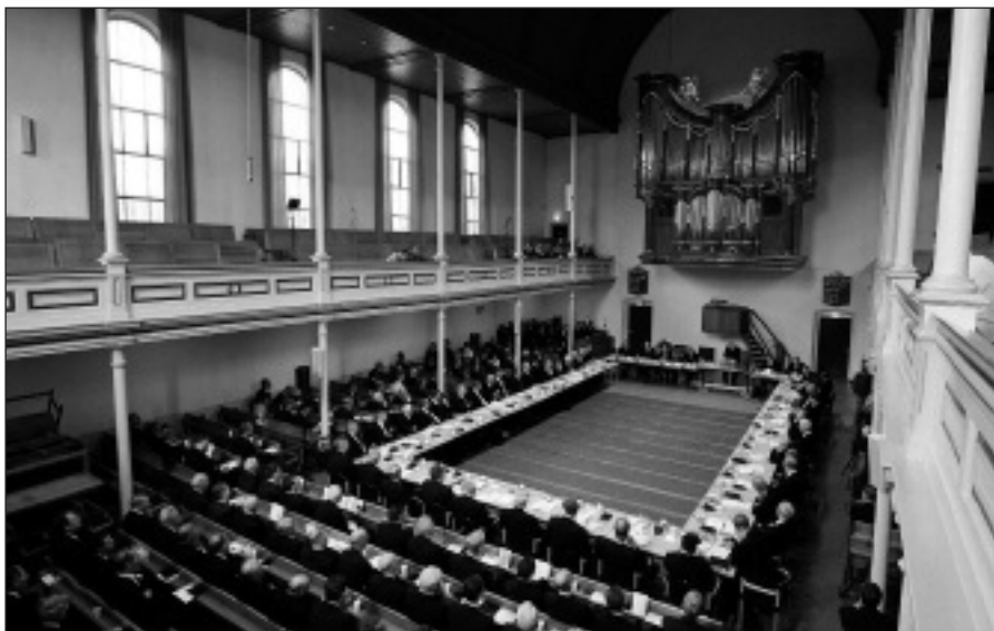
Zonder enig kerkelijk mandaat.

Daarbij moeten we echter niet in de eerste plaats denken aan de institutionele verdeeldheid: het feit dat verschillende kerkverbanden naast en tegenover elkaar bestaan. Veel fundamenteeler is de inhoudelijke verdeeldheid: de grote verschillen die er zijn in leer en leven.