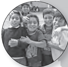
Peru Aandacht en liefde voor straatkinderen