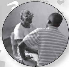
Dominicaanse Republiek Gezondheidszorg