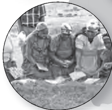
Zuid-Afrika Strijd tegen HIV / Aids