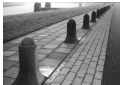
Vanuit het Woord Gods duidelijk de grenzen trekken tussen goed en kwaad

Deze Schriftgegevens tonen zonneklaar aan dat de gemeente in leer en leven moet streven naar een zuiverheid, die zich steeds toetst aan de Godsopenbaring. Hoe nodig is daarbij de werking van de Heilige Geest, wederbarend en oefenend. Door Zijn bediening dichtbij de Schrift en dichtbij de hoogste Leraar te leven, is