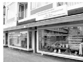
maandag gesloten gratis parkeren

www.derooboeken.nl Van Meelstraat 12 3331 KR Zwijndrecht 078-6124081 Tevens inkoop/taxatie