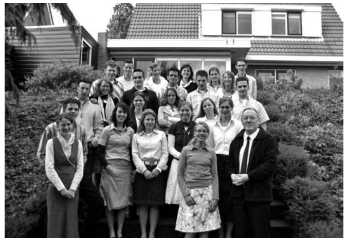
Een catechisatiegroep uit Klaaswaal.

Een andere vraag is deze: kennen we iets van die innerlijke bewogenheid die in Jezus was? Zien wij op de wereld om ons heen, dan lijkt het een verlo-