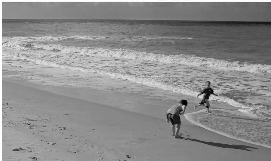
Het water laat op het strand een spoor na.

Zo ook die seksuele revolutie. Deze zoekt steeds meer nieuwe terreinen te veroveren. De golfslag langs de vloedlijn is ruimtelijk, regelmatig, rustgevend en aangenaam. Zo ervaren velen ook het opkomende seksuele denken en de bijbehorende praktijk. Heerlijk, ongebonden, vrij. Het wassende zeewater is niet te stuiten en spoelt alles weg. Niets blijft