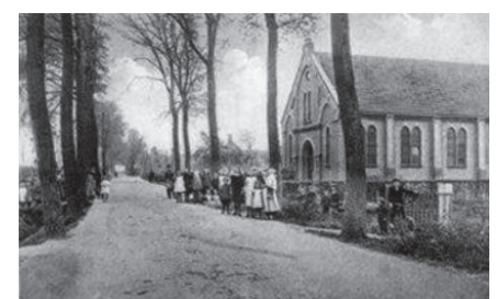
Gereformeerde Gemeente Borssele