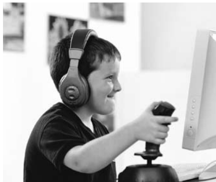
Digitale opvoeding is hard nodig.

Toch wordt het van ons gevraagd. Juist in een tijd waarin de grenzen tussen kerk en wereld vervagen, dient op de