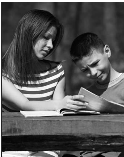
Welk beroep moet ik kiezen?

Dat het ook anders kan, bewijst het afscheid van Jozua, zoals dat in hoofdstuk 24 staat. Jozua verzamelt het volk in Sichem om afscheid van hen te nemen. Daar stelt hij het volk voor de