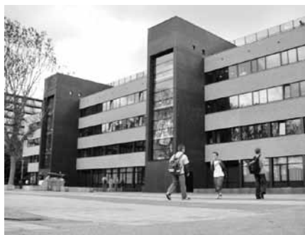
Wartburg College, Rotterdam

De jongen uit het tweede gezin stelt dezelfde vraag. Zijn vader antwoordt: