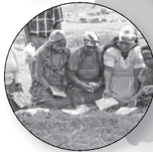
Zuid-Afrika Strijd tegen HIV / Aids