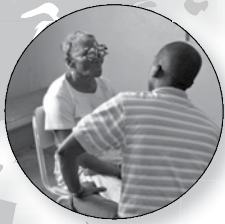
Dominicaanse Republiek Gezondheidszorg