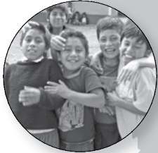
Peru Aandacht en liefde voor straatkinderen