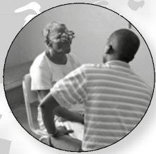
Dominicaanse Republiek Gezondheidszorg