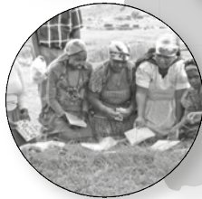
Zuid-Afrika Strijd tegen HIV / Aids