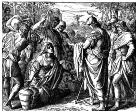
'Vergeef toch uw dienstmaagd de overtreding'

Nietsvermoedend van het dreigend gevaar zijn Nabal en zijn knechten met het schaapscheerderfeest begonnen. Nabal pakt groots uit. Het lijkt wel een koningsmaaltijd! De wijn vloeit rijkelijk, met als gevolg... Nabal wordt dronken. Als Abigaïl thuiskomt, heeft zij wel door dat dit niet het goe-