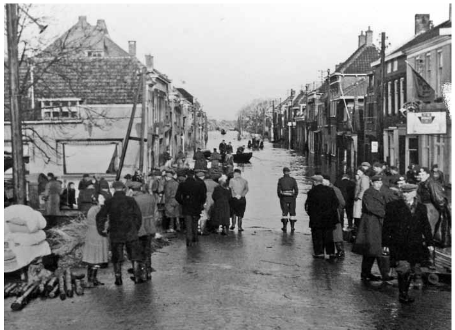
Ook Nederland kent de gevolgen van een stormramp.

ten verlaten. De grote wegen waren dan ook volgepakt met evacués. Een grote doorgaande weg met in iedere richting vijf banen, werd nu als een eenrichtings-snelweg gebruikt met tien banen. Allemaal op weg van zuid