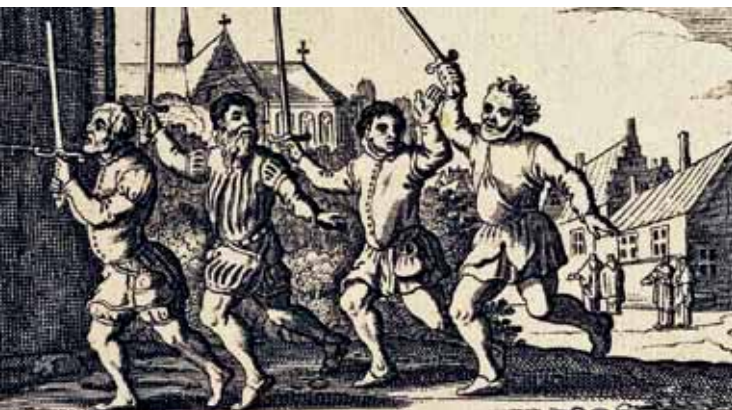
Oproerige wederdopers te Amsterdam.

Het is niet te verwonderen dat de wereldlijke gezagsdragers in de omgeving ingrepen. De stad werd belegerd. Ondanks dat de koning en de profeten het volk schitterende dingen hadden beloofd, kwam de stad in veel ellende en grote honger terecht. De koning beloofde dat ze met Pasen zouden zijn bevrijd van het beleg en van de honger. Hij hoopte kennelijk op hulp vanuit Holland en Friesland. Hij had daar vrienden heen gestuurd om een leger bijeen te brengen. Die hadden in Friesland en vooral in Amsterdam wel veel roerigheid teweeg gebracht. Daardoor kregen ze problemen met de overheden, maar een leger bijeenbrengen mislukte. In 1535 viel de stad Mün-