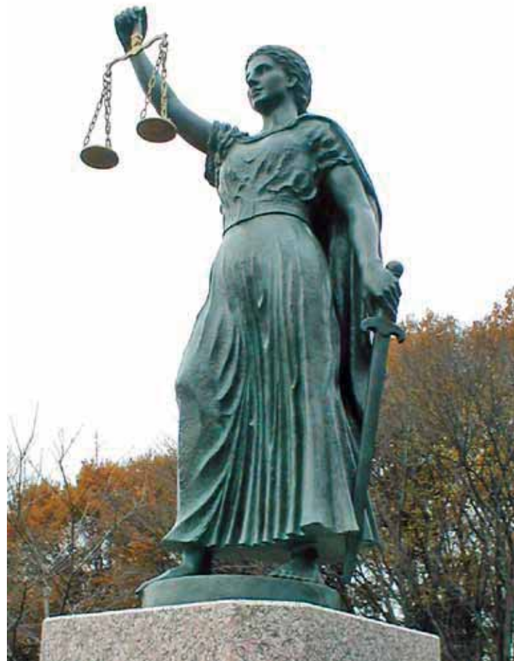
Vrouw Justitia, het beeld van 'het vonnis na een zorgvuldige afweging'

Het verwijt dat hij door zo te spreken tot wreedheid zou oproepen, werpt Guido de Brès verre van zich. 'Wij bedoelen geenszins de overheden tot wreedheid en onmenselijkheid op te wekken (dat verhoede God) ... Maar wij geven eenvoudigweg onderwijs over de last en de plicht van de overheid in haar roeping' (646). De overheden mogen van hun zetel geen galg maken. Gelovige rechters