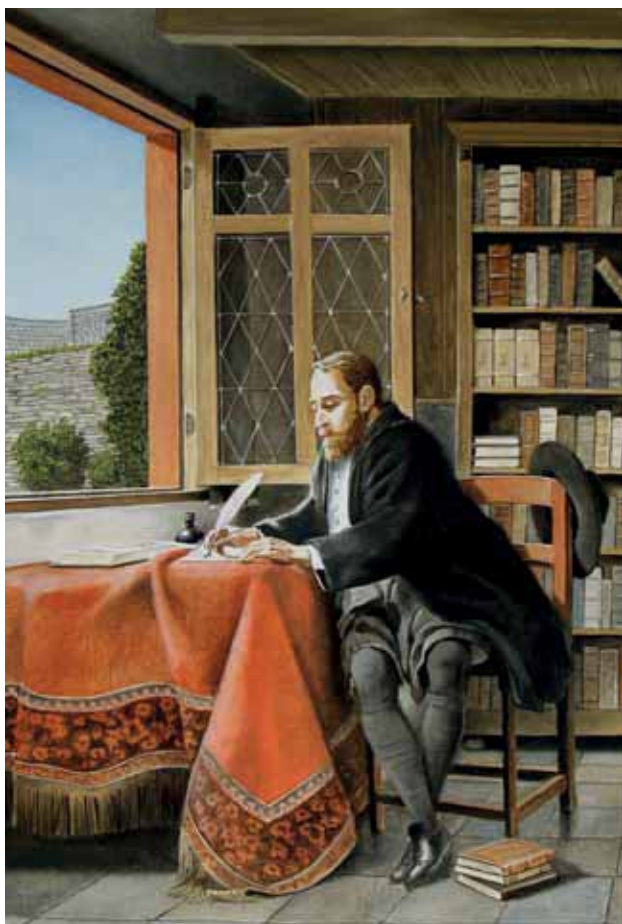
Guido de Brès in zijn studeervertrek nabij de stadsmuur.

Teruggekeerd in de Nederlanden koos hij de stad Doornik als zijn uitvalsbasis. Van daaruit predikte De Brès onvermoeibaar het Evangelie van vrije genade. Doornik