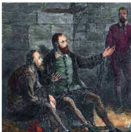
Guido de Brès in de gevangenis.

En zie, daar is nu mijn God, Die mij de hand wil reiken om mij in Zijn welgelukzalig Koninkrijk in te zamelen. Ik ga voor u uit, en wanneer het de Heere behagen zal, zult u mij volgen. Het zal niet voor altijd zijn dat de scheiding zich voltrekt. De Heere zal ook u inzamelen om ons tezamen te verenigen met ons Hoofd, Jezus Christus. Hier is de plaats van onze woning niet, zij is in de hemel; het is hier de plaats van onze vreemdelingschap.