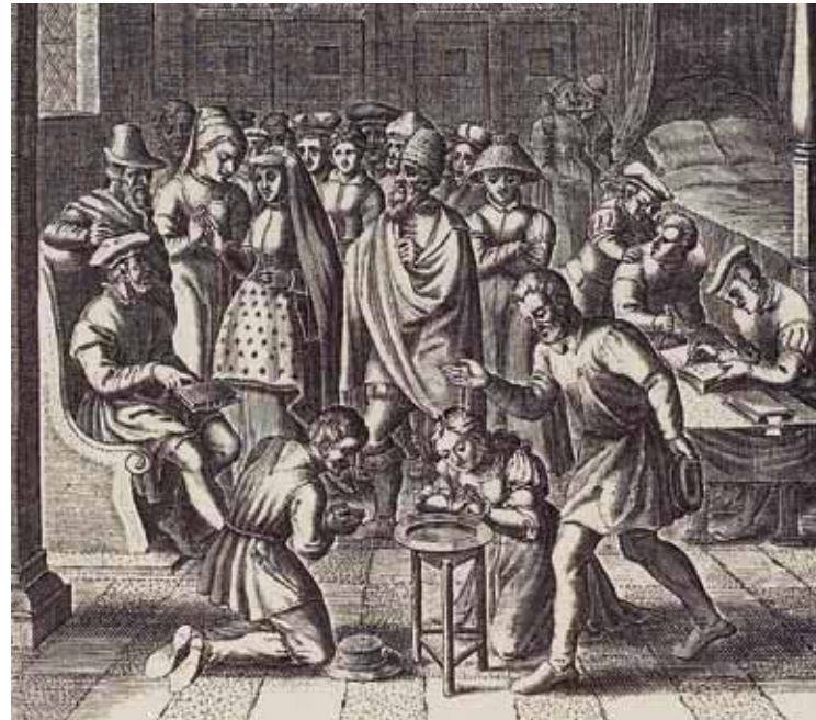
De praktijk van de wederdopers.

Waarom geen apart bevel in het Nieuwe Testament om kinderen te dopen? Dat was niet nodig, want dit bevel