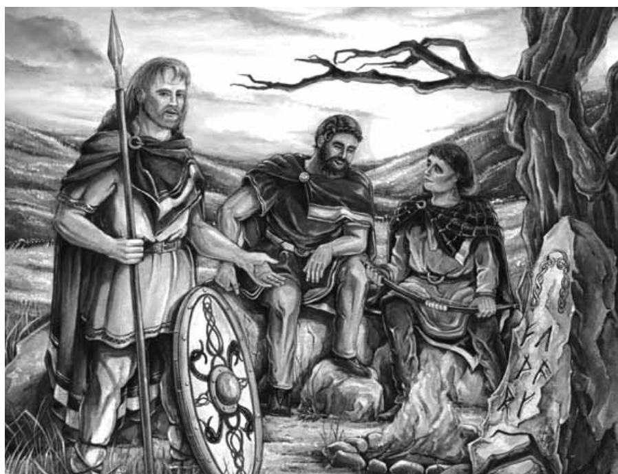
De Germanen hielden elk jaar vanaf 25 december hun Midwinterfeest, het feest van de zonnewardende.

Kerstfeest vieren bleek niet zonder risico's. Er scheen soms sprake van een soort syncretisme, vermenging van godsdiensten. Het lag zo voor de hand een relatie te leggen met heidense feesten. Bij voorbeeld met de geboortedag van de rond de Middellandse Zee vereerde afgod Mithras. De Germanen hielden elk jaar vanaf 25 december hun Midwinterfeest, het feest van de zonnewardende. Zo groeide zomaar een 'mix'. Het bleek daarbij