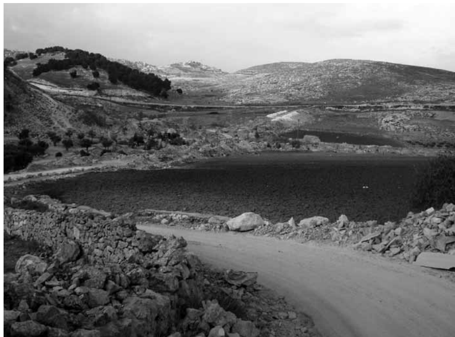
De velden van Efratha.

Vandaag heeft de stad Bethlehem weinig uitwendige schoonheid. Een verwachtingsvolle toerist zal er veel teleurstellingen opdoen. Wie echter door het geloof op de geboren Christus mag zien heeft aan Hem genoeg. '...en wij hebben Zijn heerlijkheid aanschouwd, een heerlijkheid van de Eniggeborene van de Vader, vol van genade en waarheid.' Dat is echt Kerst!