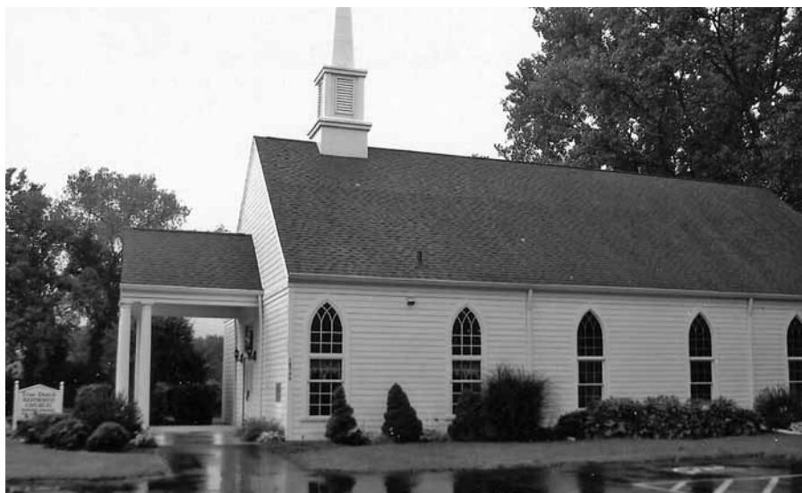
Kerkgebouw van Lansing