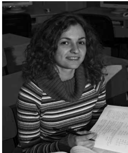
Om leerlingen te motiveren en te activeren moet je vragen stellen.

In de nationale onderwijskrant van begin oktober 2011 staat een interview met minister Van Bijsterveldt. De titel luidt: "Onderwijs moet ambitieuzer worden." De bewindsvrouw legt veel nadruk op presteren, betere opbrengsten, hogere kwaliteit, geen zesjescultuur maar extra talentontwikkeling. Nederland zakt te ver af op de wereldranglijst van kennis-economie. Ondanks de bezuinigingen moeten er betere prestaties worden geleverd. En dat kan, zo zegt mw. Van Bijsterveldt, want we werken in het onderwijs met zeer gemotiveer-