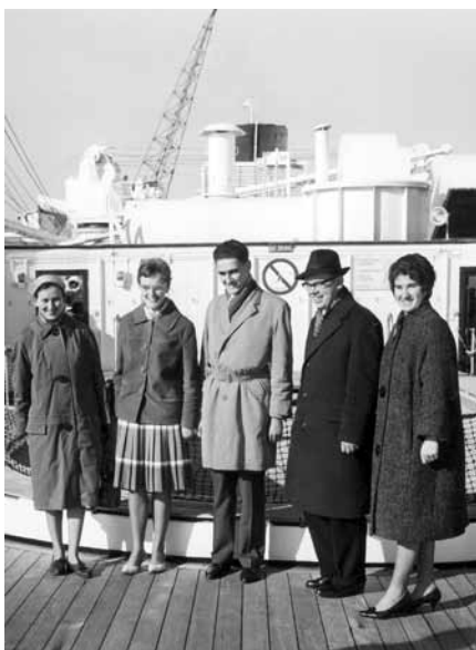
Het eerste zendingsteam