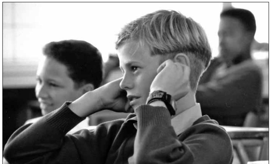
Onze kinderen zijn ook leenpanden die we niet mogen verkwanselen en voor wie we verantwoordelijk zijn.

In een vergelijkbare tijd als de onze leefde en werkte Timotheüs. In de brieven die Paulus aan hem schrijft, wordt dat wel duidelijk. Paulus schrijft deze brieven als pastorale brieven aan zijn geestelijke zoon Timotheüs. Timotheüs heeft een verantwoordelijke plaats in de gemeenten in Klein-Azie. Een jonge man, gelovig, door God geroepen en bekwaam gemaakt om zijn werk in de gemeenten te doen. Geen gemakkelijk werk in de uitbouw van de gemeenten die bedreigd werden door de heidense wereld om hen heen, maar ook door valse leerstukken binnen hen. Ga er maar aan staan. Timotheüs zal deze brief dan ook zeker als een geschenk van de Heere hebben ontvangen.