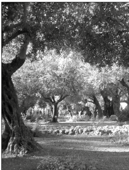
De hof van Getsemané

Bij de kruisiging was de taak van de hoofdman en zijn dienaren om de Heere Jezus te bewaren (Matth. 27:54). Hij stond tegenover het kruis (Mark. 15:39). Zodoende had deze hoofdman de gelegenheid om alles gade te slaan. Als dienaar van het Romeinse recht was hij erin geoeffend om op feiten te letten.