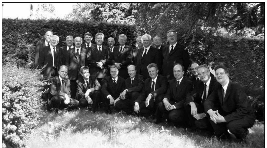
De Kerk van God heeft steeds dringend behoefte aan levende predikers.

3. Tenslotte blijkt de ware roeping hieruit, dat daarmee onder Gods voorzienigheid gepaard gaat - en dat door een reeks omstandigheden, die middelen, tijd en plaats aanwijzen - de mogelijkheid om metterdaad het werk aan te vangen. Voordat deze samenloop van omstandigheden zich voordoet, moet u niet verwachten, dat u in uw gemoed altijd vrij van aarzeling zult zijn. De voornaamste waarschuwing in dit opzicht is, dat men zich niet te haastig aan de eer-