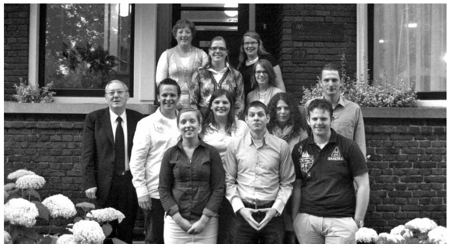
Catechetisch onderwijs kan onder Gods zegen tot behoud van onze jongeren zijn.

Nu blijven onze jongeren persoonlijk verantwoordelijk voor de beslissingen,