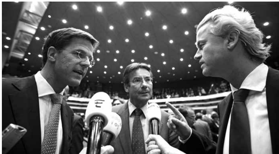
Door de kabinetscrisis en met de nieuwe verkiezingen in het vooruitzicht is de politieke situatie volstrekt onduidelijk geworden.

Door de kabinetscrisis en met de nieuwe verkiezingen in het vooruitzicht is de politieke situatie volstrekt onduidelijk geworden. Komt er opnieuw een soort van paarse coalitie? Dat behoort zeker tot de mogelijkheden.