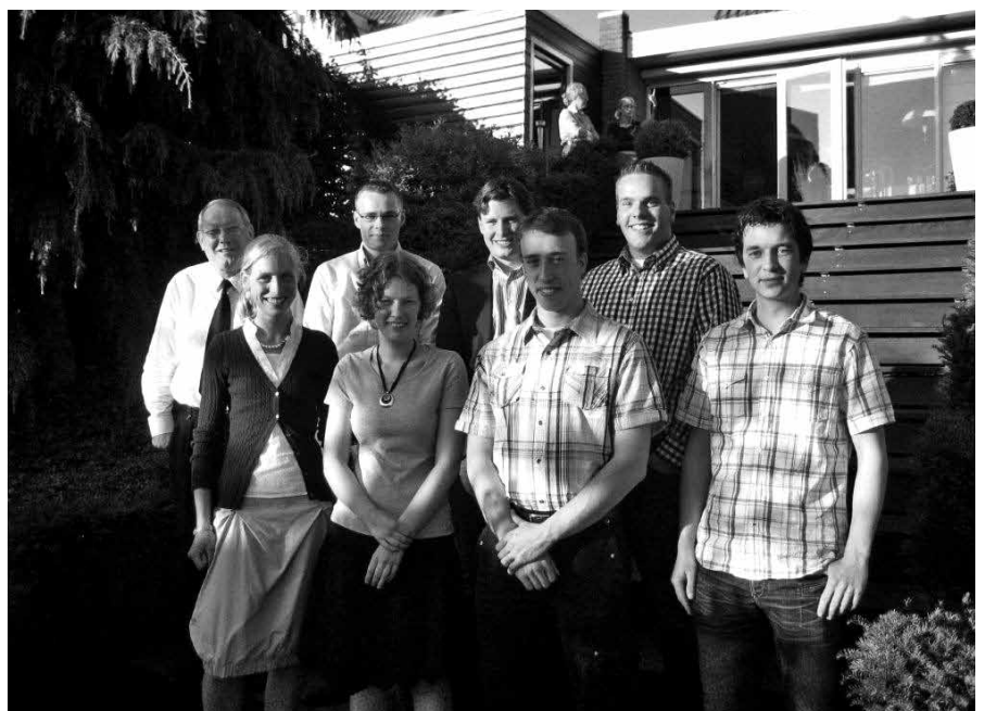
Zicht op catechese heeft alles te maken met het zicht dat men heeft op de Heilige Geest, op het genadeverbond en op de gevallen mens.

Bij het toerusten van de catecheet kan ook gedacht worden aan bijeenkomsten met ambtsdragers op classicaal niveau. Iedere omgeving kent zijn eigen specifieke problemen.