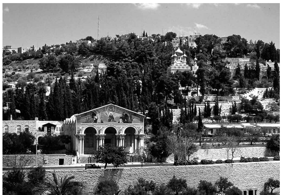
Met Zijn verheerlijkte lichaam, geschikt voor het hemelleven, vaart Hij op.

Tegen de zwaartekracht in zien de elfen Hem steeds hoger stijgen. Onverklaarbaar, maar niet onmogelijk voor Hem, Die is de Schepper van hemel en aarde. Steeds hoger zal Hij gaan, door de ijler wordende lucht heen, de lage temperaturen kunnen Hem niet deren. Met Zijn verheerlijkte lichaam, geschikt voor het hemelleven,