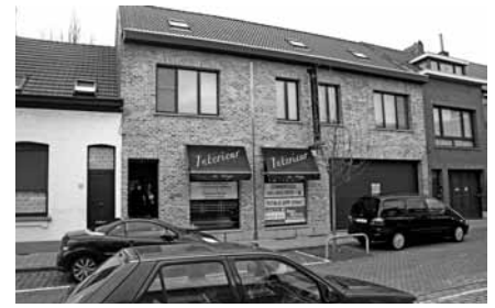
Een vroegere winkel wordt het nieuwe onderkomen van de evangelisatiepost.

'We zochten een laagdrempelige manier om met het armere deel van de bevolking in contact te komen', zegt de evangelist. 'Voedselbanken waren er in de stad al, maar we zagen de schamele kleding van de mensen die daar in de rij stonden. Dat bracht ons op het idee van een kledingproject. Het is bestemd voor de minima –vaak allochtonen– die een verwijzing van een hulpverleningsinstantie hebben. In het inloophuis ontvangen we de mensen met soep en stokbrood, waarbij ik een gebed doe en over het Bijbelgedeelte spreek dat ik voorlees. Overigens valt me dan op hoe eerbiedig oudere moslimmannen hun hoofddeksel afnemen. Een van hen zei: 'Ik