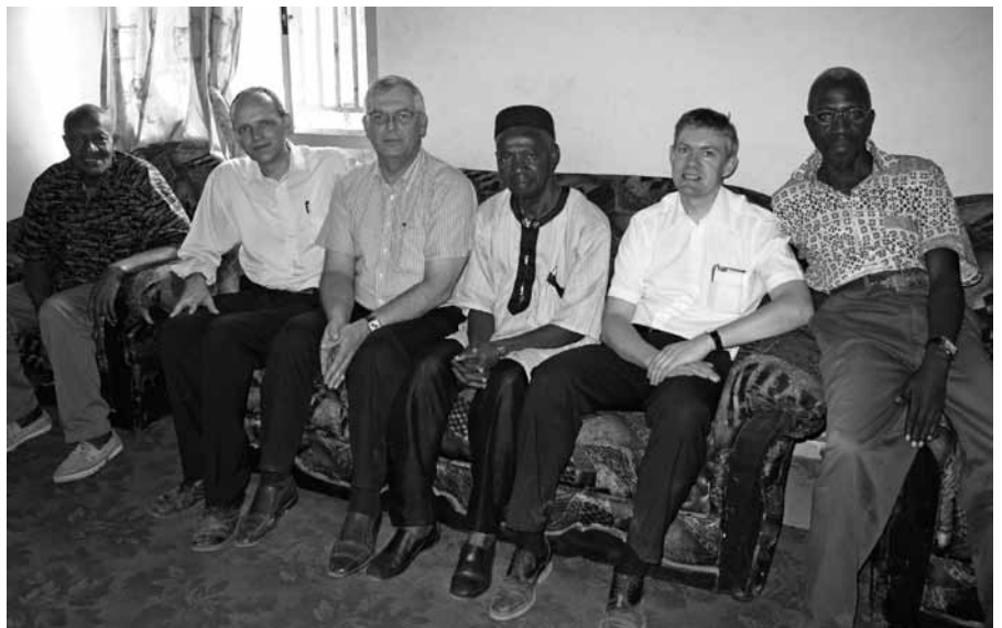
De ontmoeting met deze mensen heeft diepe indruk op ons gemaakt.