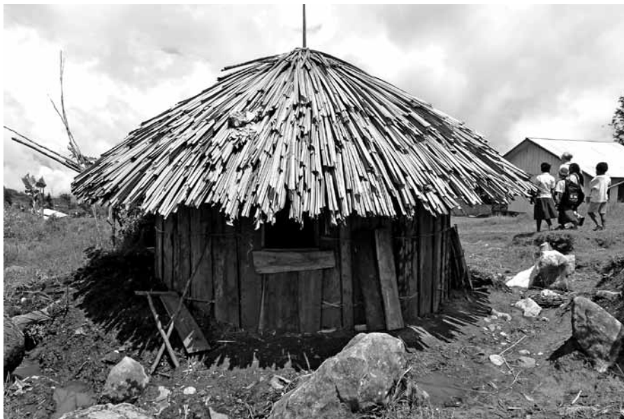
Gehoorzamen, dienen en volgen, dat de beste weg, als de Heere roept.

Wonderlijk, dat deze belangrijke man zich niet gehinderd voelt door die