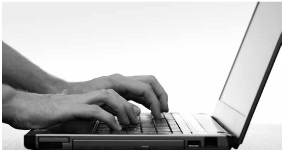
Inmiddels wordt de positie van Kliksafe bedreigd door nieuwe wetgeving.

Nu ziet Kliksafe gelukkig nog wel weer bepaalde ontsnappingsmogelijkheden. Maar het gaat hier wel om een duidelijke inbreuk op een in onze maatschappij wezenlijke zaak als de contracteervrijheid. Men kan straks geen internetaansluiting meer nemen bij een provider die op morele gronden een flink aantal sites heeft afgesloten. De meerderheid vindt