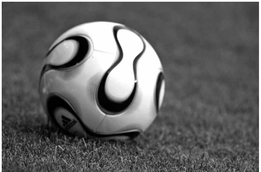
De Bijbel wijst ook op onze levenswandel. De wereld is zo dichtbij.

Maar nog een stap verder. Hoe is ons eigen leven als ouderen? Kinderogen zien scherp. Leven wij voor de vakantie, een goede maaltijd, meer geld verdienen en verjaardagen? Leven we ook ons lieve en fijne leventje? Is ons leven eigenlijk ook alleen maar gevuld met aardse dingen? Dan is er wezenlijk eigenlijk niet veel verschil