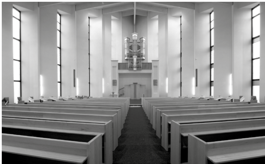
Het interieur van het nieuwe kerkgebouw van de Gereformeerde Gemeente te Sliedrecht.

ring. 'Omdat er een breed draagvlak voor de plannen bestond en de moedergemeente ons een 'bruidsschat' in het vooruitzicht stelde, was het naar onze mening verantwoord het geheel uit te voeren. Dat neemt niet weg dat we vaak verwonderd hebben gestaan over de offervaardigheid van de gemeente. Uiteraard hebben we ook keuzes moeten maken. Zo was het financieel niet haalbaar een pijporgel aan te schaffen. Maar met het huidige elektronische orgel kan er ook uitstekend worden gezongen'.