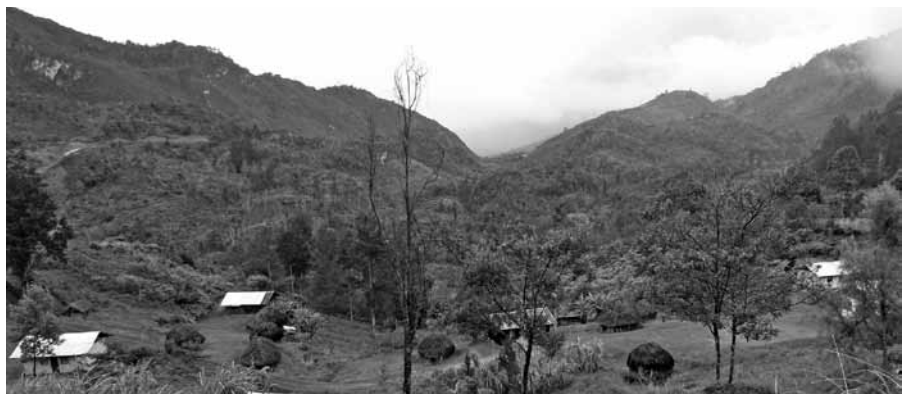
Alleen Uw wil geschiedde, en onze plannen gaan opzij.