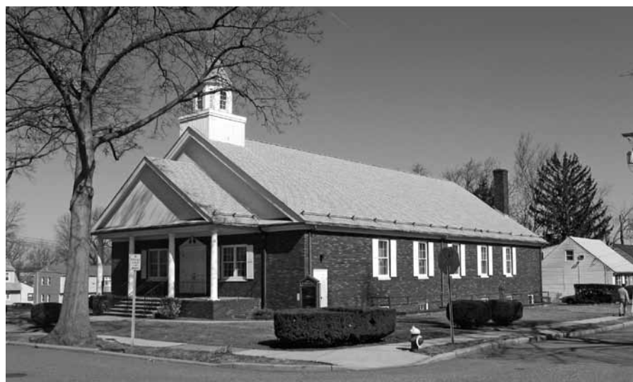
Het kerkgebouw van de gemeente Clifton in New Jersey.

De redactie van de "Banier der Waarheid", het maandblad van de gemeenten, wenste de weduwe sterkte toe. 'Wat een zegen dat zij mag leven in het vooruitzicht van een spoedige hereniging. Des Heeren kinderen scheiden maar voor een tijd'.