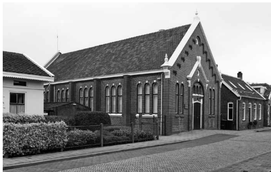
Ook in Wolphaartsdijk zijn er stenen toegevoegd tot het geestelijke Godsgebouw.