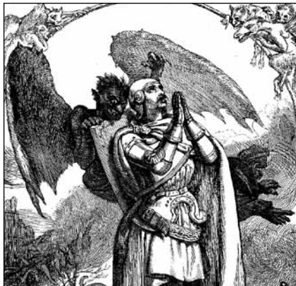
Christen in het dal der schaduwen des doods

Wat is nu die schrik des Heeren? Het is niet anders dan het 'schrikkelijke en vreselijke oordeel des Heeren', zoals onze kanttekeningen opmerken. De volle diepte van die schrik des Heeren is de eeuwige pijn, de verschrikking van de hel. Het Griekse woord voor schrik heeft te maken met het Bijbelse woord vreze, de vreze des Heeren. Die oudtestamentische uitdrukking heeft niet de betekenis van angst, maar van eerbied en ontzag. Het is een woord waarin ook liefde ligt opgesloten. Het is de kinderlijke vreze en niet de slaafse vreze. Wie de Heere leert liefhebben, leert Hem vrezen. De vreze des Heeren verbindt dan ook aan de Heere en doet niet van Hem wegluchten. Dan zal