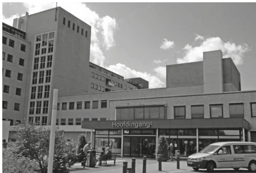
Van al die christelijke ziekenhuizen is nauwelijks meer wat over.

Al is de medische kennis tot grote hoogte gestegen, toch zijn niet alle ziekten te genezen en verlopen niet alle operaties succesvol. In een ziekenhuis worden heel wat doodvonnissen uitgesproken, zo formuleerde een specialist het onlangs in het RD. Zo'n boodschap komt hard aan. Artsen worden tegenwoordig getraind in het houden van slecht-nieuws gesprekken. Zeker in dergelijke situaties is er behoefte aan geestelijke ondersteuning.