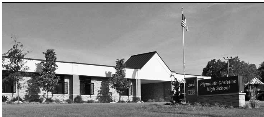
Plymouth Christian High School.

Vrijdagmiddag werd de conferentie gesloten. Velen gingen naar huis, maar sommigen knoopten er nog een paar dagen aan vast om met beken-