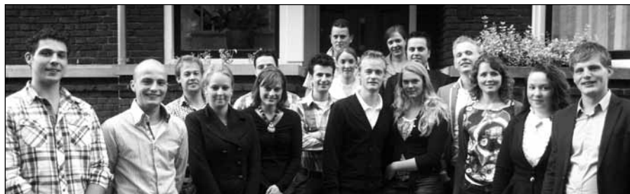
De keuze vraagt namelijk voorbereiding; allereerst op je knieën.

Hopelijk weegt voor jou de vraag: zal ik nú - mede gezien mijn leeftijd - de belijdeniscatechisatie gaan volgen? Deze keuze vraagt namelijk voorbereiding, allereerst op je knieën. Een levenskeuze die bewust en weloverwogen gemaakt dient te worden, wil het geen teleurstelling worden voor jezelf en voor je omgeving. Het gaat immers wel om ernst en oprechtheid. Zodat je goed beseft: wat houdt belijdenis doen in? Voor het heden en de toekomst. Je ouders wensen niets liever dan dat je weloverwogen gaat in het spoor dat zij in alle gebrek je heb-