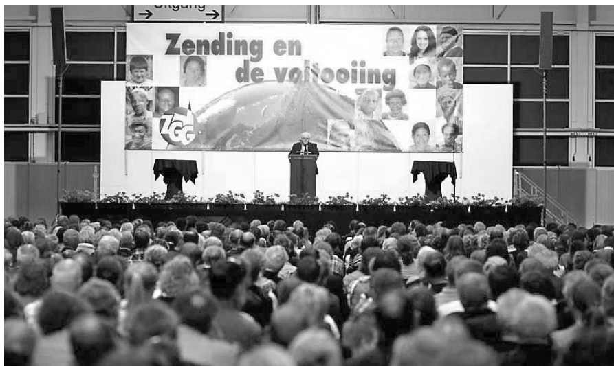
De jaarlijkse zendingen dag.

aan verbonden, maar er is een hele reeks zendingenwerk(st)ers geweest, die de arbeid daar heeft verricht. Wat een wonder dat de Gereformeerde Gemeenten ook gestalte mochten gaan geven aan de zendingsofdracht, die Christus Zijn gemeente heeft nagelaten.