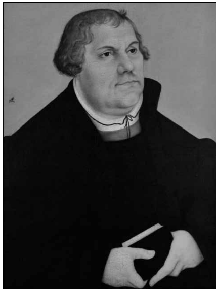
Het laatste portret van Luther (1539)

In 1539 maakte Cranach het laatste portret van Luther. "De man wendt zich naar rechts en richt zijn blik in de verte. Hij heeft witgrijs krullend haar. In het gelaat van de man zijn ouderdomstrekken zichtbaar. Hij draagt een zwart geleerdengewaad. In zijn handen houdt hij een boek vast."