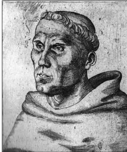
Luther als Augustijner monnik (1520)

Dit portret wordt wel de ernstigste genoemd van alle portretten die Cranach schilderde. Luther was in deze jaren verwickeld in de strijd met de paus en met de gehele roomse geestelijkheid. De paus dreigde hem in 1520 met de ban, een jaar later volgde de bevestiging en zou ook de keizer zich tegen hem keren. Weliswaar zag het Duitse volk in hem een held, maar Luther, klein in zichzelf, wist dat de zaak Gods in het geding was. Daarvan getuigt de brief van Luther op 31 oktober 1517,