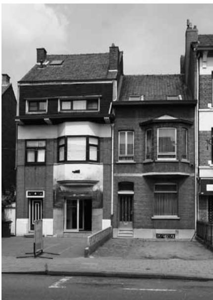
Evangelisatiepost in Merkssem