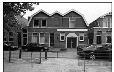
Kerkgebouw gemeente Zaandam