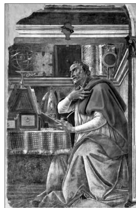
Augustinus heeft tegen de leer van het noodlot gestreden.

Zelfs onder de heidenen is er een vaag besef van de voorzienigheid. Elk mens heeft een ingeschapen Godskennis. Door die Godskennis kunnen wij in de natuur de prediking van de Schepper waarnemen. De natuur is als een schoon boek, waarin alle schepselen als letters zijn, die ons de onzienlijke dingen te verstaan geven (NGB, art 2). Wij bevinden ons midden tussen Gods almachtige werken. Paulus zegt in Romeinen 1:20, dat daarom de heidenen niet te verontschuldigen zijn, omdat ze dat licht der natuur, deze waarheid, in ongerechtigheid ten onder hebben gehouden. Ze hebben