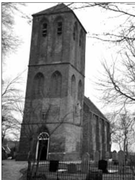
De kerk, ooit een gerespecteerd maatschappelijk instituut; waaraan menigeen nostalgisch terugdenkt...

Tal van eigentijdse theologen in de breedte van de kerk reflecteren op de marginalisering alsof veelkleurigheid, Schwung, of verjonging de trend van gebrek aan respect kunnen keren. Dat lukt niet. 'Het kàn niet anders', schreef