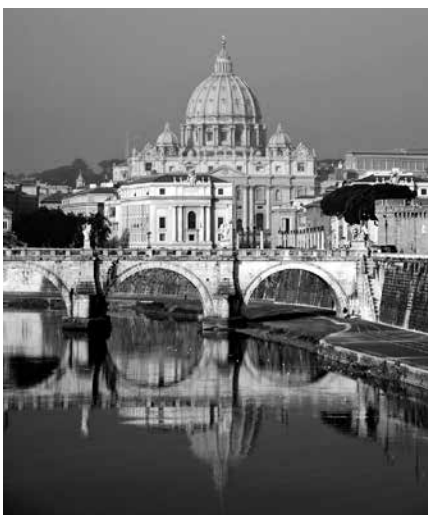
De Sint Pieterbasiliek in Rome.

Onze Dordtse Kerkorde draagt duidelijk een anti-hiërarchisch karakter. Van pausen en bisschoppen wil men niet weten. 'Geen kerk zal over andere kerken, geen dienaar over andere dienaren, geen ouderling of diaken over andere ouderlingen of diakenen