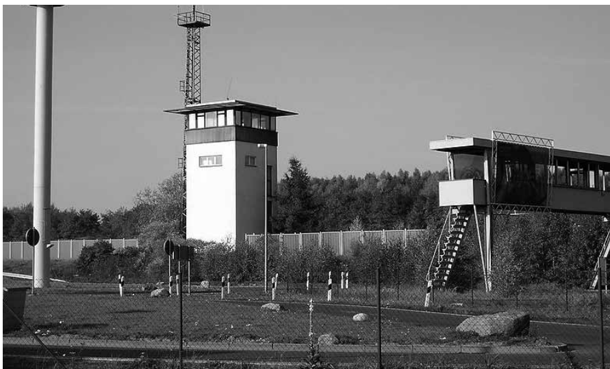
Gehoorzaamheid blijft wel degelijk een Bijbels opvoedingsdoel. We mogen de grens niet verleggen. Foto: Grensovergang Helmstedt-Marienborn.