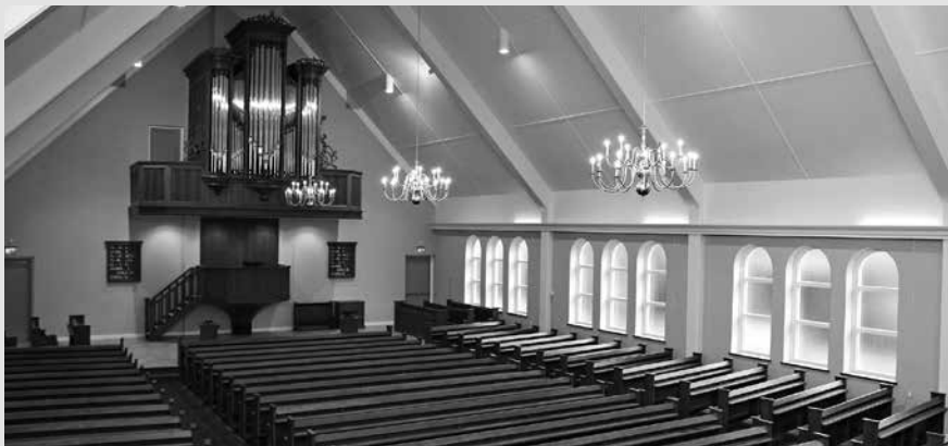
De gemeente Aalburg heeft haar nieuwe kerkgebouw in gebruik genomen.