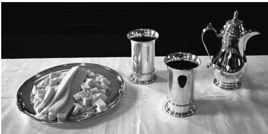
De zaligheid ligt in de gerechtigheid die Christus als Borg heeft aangebracht.

Dan is het niet genoeg om in het algemeen te weten dat de Heere Jezus gestorven is aan het kruis, ja dan is het zelfs niet genoeg om te weten dat het mogelijk is om zalig te worden door de Heere Jezus. Dit is op zich al groot dat de Heere dat gaat leren. Maar