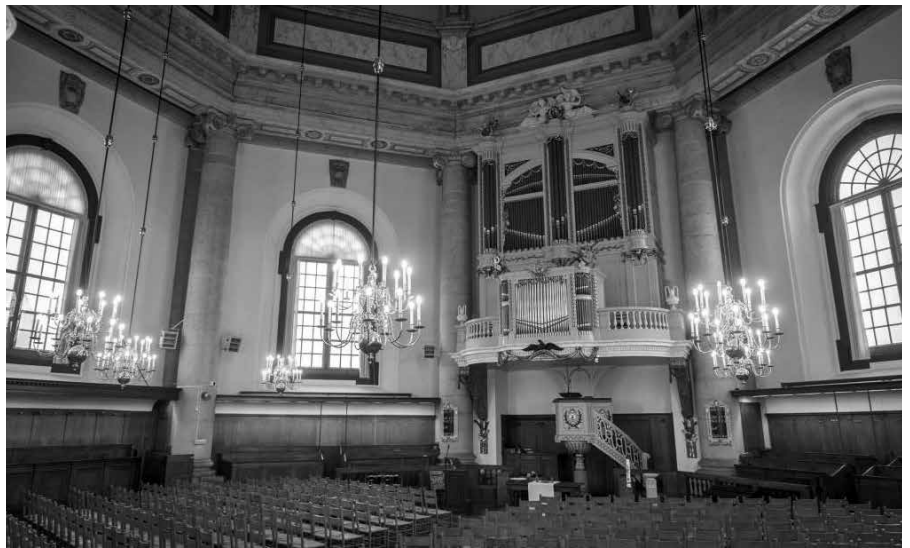
De monumentale Oostkerk te Middelburg is in gebruik als kerkgebouw voor de protestantse eredienst. In deze kerk hebben vele bekende predikanten gepreekt.

Petrus Immens kwam in 1698 van Bommel en bleef tot zijn dood in Middelburg. Zijn naam is onder ons