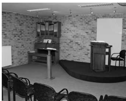
Het nieuwe onderkomen, 'De Bron', ligt in het centrum van Merksem.