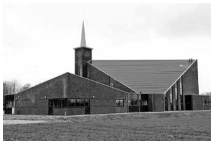
Het nieuwe kerkgebouw ligt aan de oprijlaan naar de begraafplaats. Mede daarom gaf de gemeente het kerkgebouw de naam 'De Levensbron'.