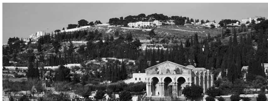
Zicht op de olijfborg.