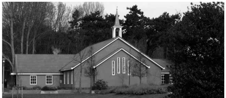
Kerkgebouw "De fontein", Vrijgemaakt Gereformeerde Kerk, Katwijk

brede protestantse wereld, zeg maar het midden van de Protestantse Kerk in Nederland. Zij hebben niet zoveel meer met het gereformeerde. Theologisch en cultureel willen zij hun vleugels breder uitslaan. Dat de deputaten van hun kerk ingegaan zijn op de uitnodiging van de Protestantse Kerk voor een gesprek over kerkelijke toenadering, juichen ze toe. Wellicht is in de toekomst eenwording mogelijk. De vrouw in het ambt is voor hen geen punt. Of beter gezegd: aan de achterstelling van de vrouw in de kerk moet zo gauw mogelijk een eind komen. Over homoseksuele relaties en onge-